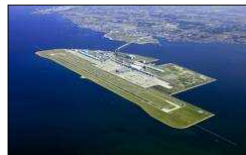
中部国際空港(セントレア)