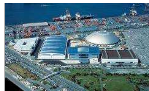
ポートメッセなごや