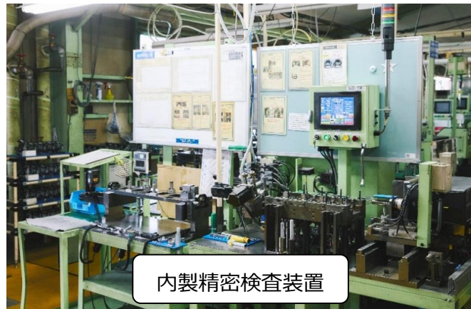
内製精密検査装置