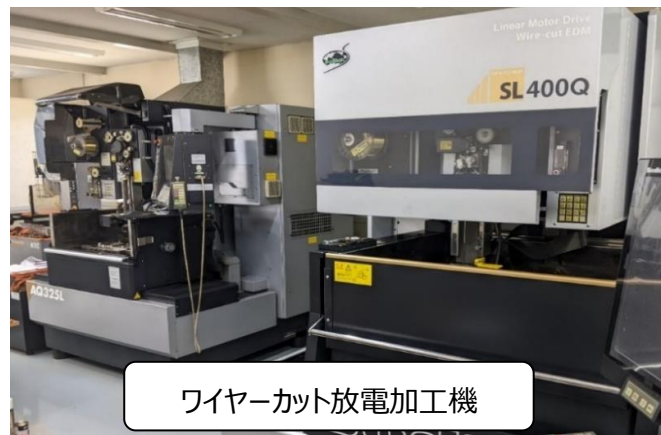
ワイヤーカット放電加工機