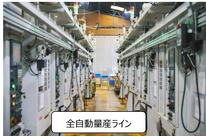
全自動量産ライン