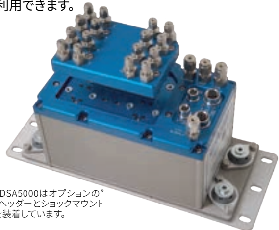
写真のDSA5000はオプションの“QD”Pxヘッダーとショックマウントキットを装着しています。

標準のDSA5000モジュールには、単一のリファレンスポートにマニホールドされた16個すべてのトランスデューサーにリファレンスが付属しています。DSAがデュアルレンジユニットとして注文された場合、リファレンスポートが各レンジに提供されます。オプションとして、DSAは、16チャンネルすべての個別のリファレンスポートを使用して構成できます。差圧測定が必要な場合、8チャンネルの「True Differential」構成により、個々のトランスデューサーの両側に入力と校正バルブが提供されます。絶対配置も利用できます。