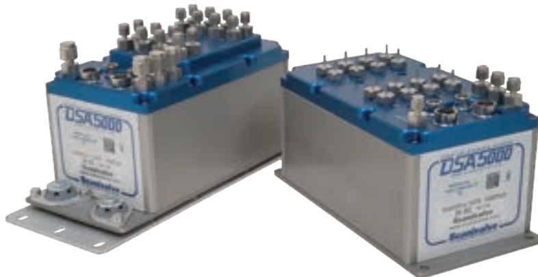
DSA5000 - Standard (right) DSA5000 - “QD” w/shock (left)